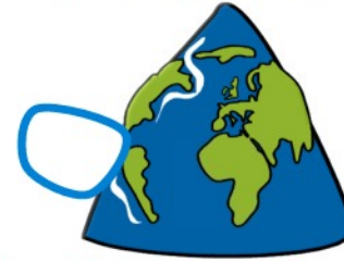
Meine Welt ist Spitze!