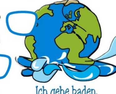
Ich gehe baden.