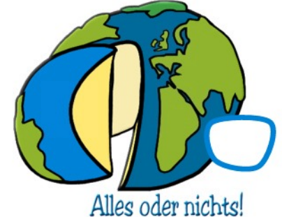
Alles oder nichts!