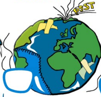
Wer hilft mir?