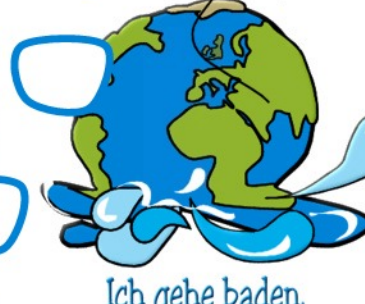
Ich gehe baden.