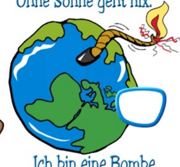
Ich bin eine Bombe.