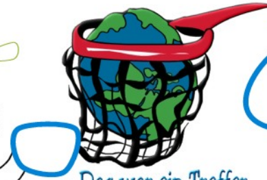
Das war ein Treffer.