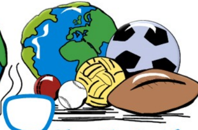
Wer spielt mit mir?