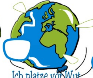
Ich platze vor Wut.