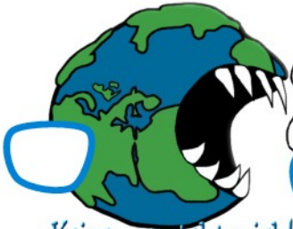
Keiner versteht mich!