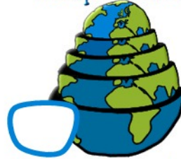
Es gibt nur eine Welt.