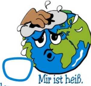
Mir ist heiß.