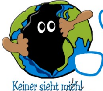
Keiner sieht mich!