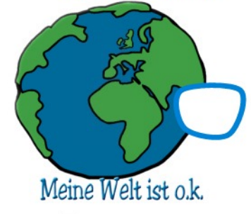
Meine Welt ist o.k.