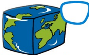
Die Welt ist nicht immer rund.