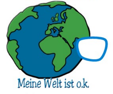
Meine Welt ist o.k.