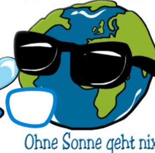
Ohne Sonne geht nix.